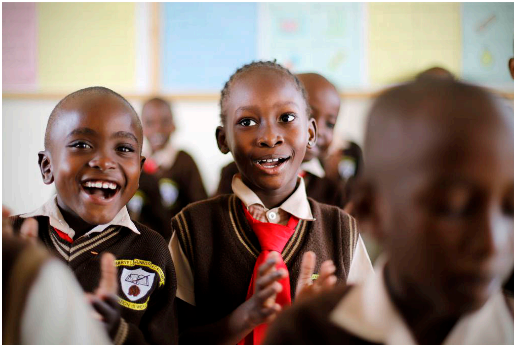
Marvel Junior Academy i Kimbeni nord for Mombasa har 280 elever og 20 ansatte.