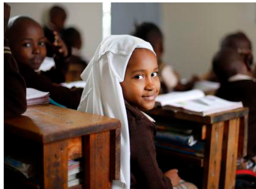
I dag kan 85 pct. af befolkningen i Kenya læse og skrive.