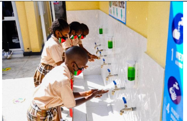
Udover stole til bedre afstand er der indført en masse tiltag for forbedret hygiejne.