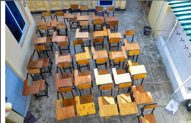
Nogle af de nye stole står klar til brug til Class 4-8

Støtten fra Honorarfonden gik til indkøb af 150 en-mands pulte så eleverne på de større klassetrin kan sidde med god afstand i klasselokalene.