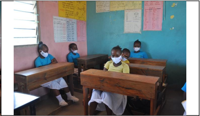
Og så vidt muligt holdes afstand