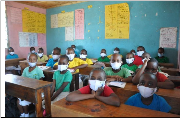
I klassen – alle skal bære mundbind hele dagen

Støtten fra Erik Thunes Legat er brugt til at forbedre hygiejnen på skolen, med indkøb af mundbind (to stk per elev og ansat), ekstra håndvaske, vandtanke, sæbedispensere termometre og andre ting der gør det nemmere at holde en eventuel Covid-19 smitten nede.