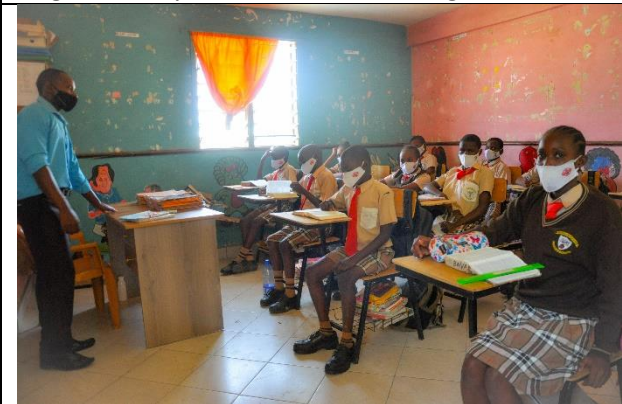
Class 4-8 bruger de nye stole