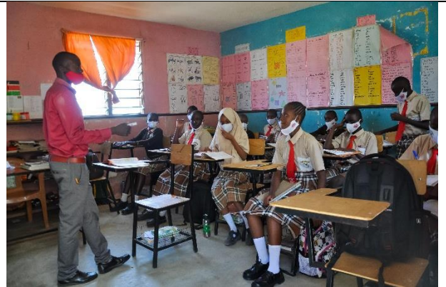
Alle bruger mundbind hele skoledagen.