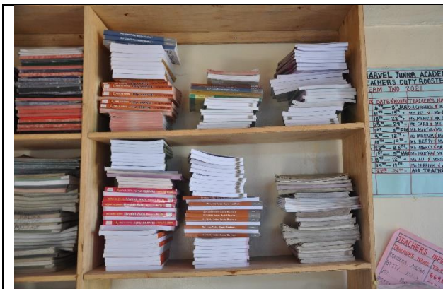
Stakke af nye lærebøger

Klassesæt af lærebøger er indkøbt med støtte fra Fonden af 17-12-1981, VMOK Fonden og Fonden af 24-12-2008. Midlerne dækker omkring 80% af det samlede beløb og håbet er at vi kan dække resten med en ansøgning i 2021.