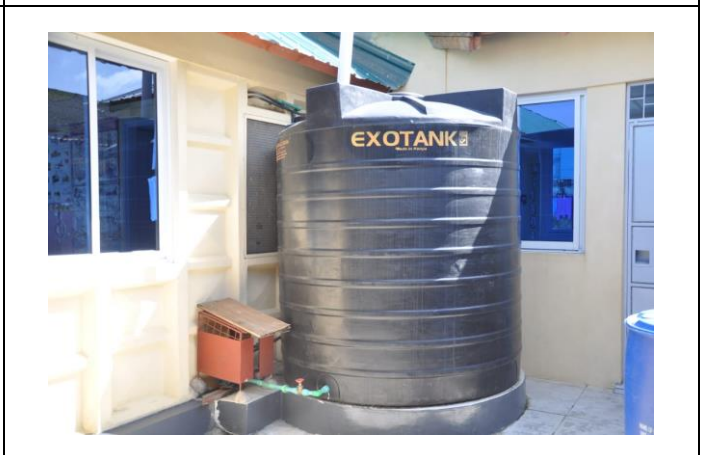
Mere håndvask skaber behov for flere vandtanke